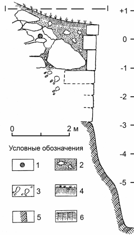
Рис. 1. Укрепление А.I (по А.Г.Герцену и В.А.Сидоренко) 1 — клад, 2 — слой натечного грунта со щебнем, 3 — бутovo-щебневая подсыпка, 4 — дерновый слой, 5 — скала, 6 — обрывы скалы

Перейдем к атрибуции нумизматического материала. Заметим, что исследователи с большой тщательностью изучили состав монетного собрания. По хорошо заметной особенности оформления — замене последней буквы легенды реверса на точку, они определили вариацию солида Льва III Исавра, послужившую образцом для копирования [1, 126]. По их мнению, такой признак имели номизмы константинопольской чеканки 725—732 гг. На самом деле их выпускали в 732—741 гг. [5]. Отметим также, что легенды аверса и реверса мангупских подражаний несколько отличаются от ординарных надписей солидов Льва III Исавра. Так, на лицевой стороне имитаций можно разобрать «NDLEOIAMЧЛ», а на оборотной читается «DNKONSTANTINЧ.». Однако на солидах Льва III Исавра такая легенда реверса неизвестна. К примеру, на золотых этого правителя, чеканенных в 732—741 гг. выбивали «DNKONSTANTINЧS» [6]. Вернее всего, образцом для копирования послужил солид какого-то неизвестного монетного двора.