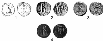
Рис. 4. Херсонско-византийские монеты с «В» на аверсе и с крестом, окруженным надписью ΒΑΣΙΛΕΥΣ[ΛΕ]ΩΝΚΟΝ[Ν]ΣΤΑΝΤΙΝΟΥΣ на реверсе

чтобы портрет автократора и соответствующая ему подпись находились бы по центру [6, 496—500]. Считаем, что выпуск литой монеты с «В» на аверсе и с крестом и легендой ΒΑΣΙΛΕΥΣ[ΛΕ]ΩΝΚΟΝ[Ν]ΣΤΑΝΤΙΝΟΥΣ (Βασίλειος [Λέ]ων) (Κο[v]σταντίνος) на реверсе следует относить к совместному правлению Василия I Македонянина, Льва VI Мудрого и Константина, т.е. к 870—879 гг. Заметим, что нашему предположению не противоречит наличие на ее аверсе единственного элемента оформления — большой буквы «В», что, как известно, было свойственно именно херсонским эмиссиям основателя Македонской династии [15].